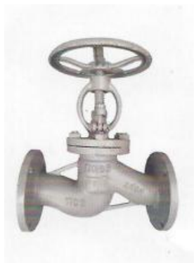
КЛАПАН ЗАПОРНЫЙ (ВЕНТИЛЬ) ФЛАНЦЕВЫЙ (15С65НЖ) РУ 1,6 МРА (16КГС/СМ2)