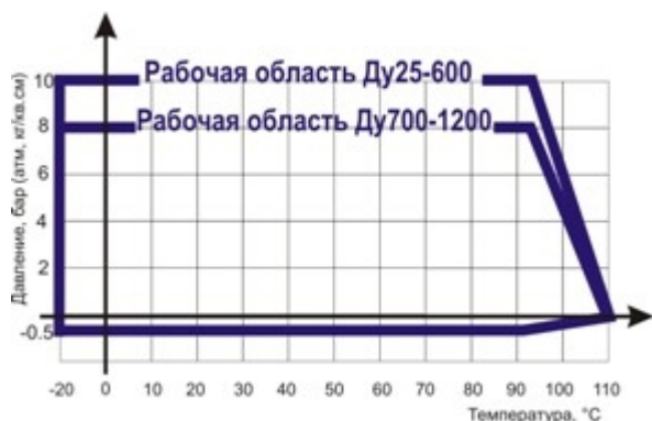
Диаграмма определяет рабочую область для гибких вставок резьбовых - антивибрационных компенсаторов в координатах Давление (в барах приборного) / Температура (° C).